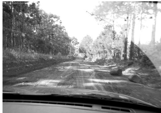
写真 3 雨後のガルアペー移住地

車の運転は確かに難しいであろうと思われた。入植地内の主な道路については役場が石をいれ たりして整備しているということだったけれど、さらなる改善が求められるようだ。この質問 18 に関する他の意見としては、日系 2 世から 4 世の人には子供たちに日本の良い習慣を守り 続けてほしいとか、通信手段（とくにインターネット）の確保などの意見が挙げられていた。