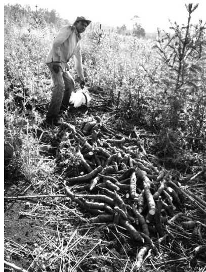
写真 4 松の植林の間のマンジョカ収穫

質問 24 の開墾地面積と未開墾地面積については、無回答1人を除いて12戸の平均開墾面積は81.3ha