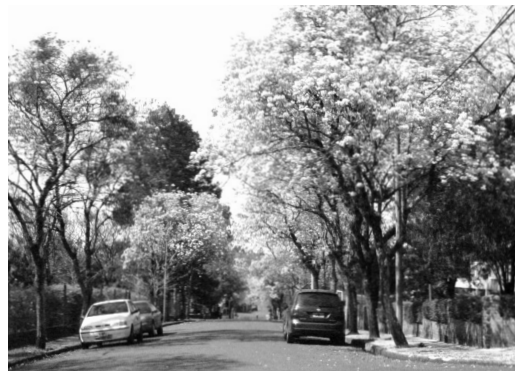
写真 2 プエルトリコの町の州花ラパッチョの花

質問 14 から質問 17 が身の回りの状況、施設等に関するものである。質問 14 のガルアペー入植地の住みやすさに関しては、