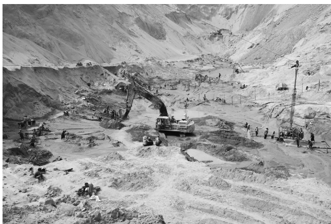
写真1 砂を露天掘りで掘っている。作業する人が小さく見える

とにかくでかい。最初にのぞいた時の印象はクレーターのようだった（写真1）。直径はどのくらいあろうか。説明員に聞いたところ「分からない」との返事だった。関心もなさそうだ。深さは500mだろうか。直径2～3kmはありそうに思えた。