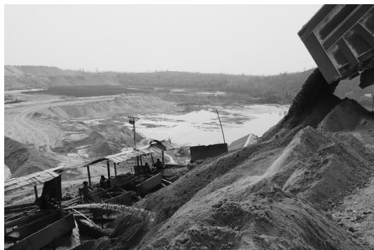
写真3 掘った砂を工場にトラックで運ぶ

この作業所では、別の場所から大型トラックで運ばれる砂に水をかけて流し、金を採る作業と、先ほど視察した露天掘りから金がある程度まとめた状態にした2つのルート処理があるとの説明だった。