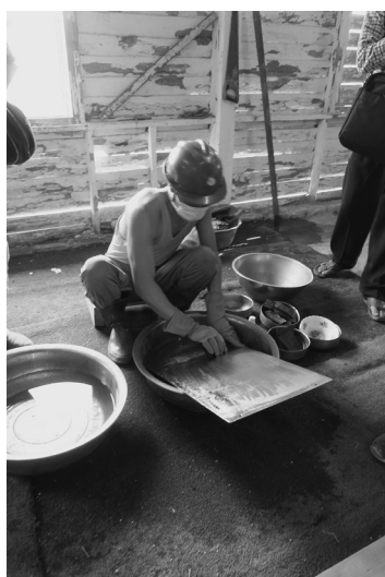
写真4 金を取り出す工程

板の表面に小さい容器に入った水銀（液体）をふりかけ、板の表面をこさぎ取るようにして集めた液体を布で絞ると固体のアマルガムが出来上がる。