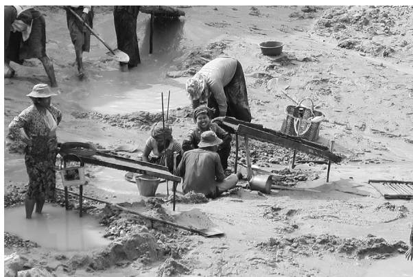
写真2 露天の中で作業するのはほとんど手作業だ

ここの露天掘りは8年前から始まった。あちこちを試掘して、ここの調査で金鉱脈がありそうだとなって掘ってみた。鉱脈を見つけるのは鉱山局の仕事である。その後、ありそうなところをマークして、会社や個人が掘っていく。