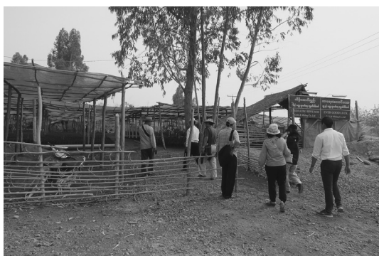
写真7 植林用の苗を育てているハウス

ここでは植林用の木を8年前から育てている。金の採掘を始めたころからで、育てているのはチーク材である。企業が主導して苗を育て、植林をしている。大きなハウス（写真7）で苗を育てていた。環境に一定の配慮をしている様子うかがえた。