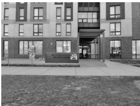
図4 (上)、5 (中)、6 (下) (上) 住宅の再生が進むコッテジ・グローブ (中) 建替えたセクション8住宅 リソースセンター入口 (下) コミュニティセンター